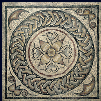
Mosaïque décorative Terre cuite Époque gallo-romaine INV : J 609

Ce volume rassemble les communications présentées lors du colloque qui s'est tenu au musée des Beaux-Arts et d'Archéologie de Besançon le 21 février 2024, étape finale du projet I-Site Making Sequania space. Territorial identity and patrimonial dynamics . Cette journée avait pour objectif d'offrir une meilleure visibilité à quelques-unes des problématiques liées au territoire séquane (funéraires, religieuses, sociales, économiques, politiques...), en approfondissant notre connaissance de cet espace, de ses limites, de son organisation, de sa population et de ses habitudes, principalement dans le cadre chronologique que nous avons retenu, allant de la conquête césarienne aux réformes de Dioclétien (I er siècle avant J.-C. – fin du III e siècle de notre ère). Les contributions ont été organisées en quatre axes. La première traite de quelques aspects de la structuration de l'espace séquane. Les questions économiques sont ensuite abordées à travers la circulation des monnaies sur le territoire, tandis que la société séquane est appréhendée grâce à l'étude de l'onomastique de la population et de ses pratiques culturelles. La dernière partie, intitulée « Les Séquanes dans le temps », permet d'envisager la façon dont les Francs-Comtois ont perçu et valorisé leur héritage antique.